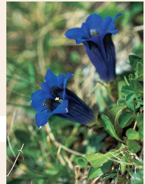
... Enzian ...

Es soll also eine fortwährende Kontrolle gewährleistet sein. Aus diesem Grund wäre es auch sinnlos, wenn ein Beamter aus Klagenfurt Jagdschutz in Heiligenblut ausüben würde. Hier wäre vielleicht die