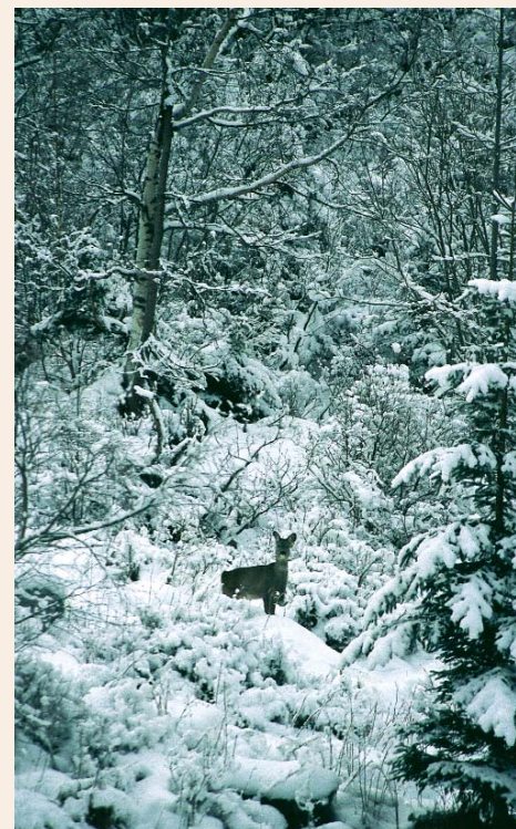
... die Flucht des Wildes behindernde Schneelage