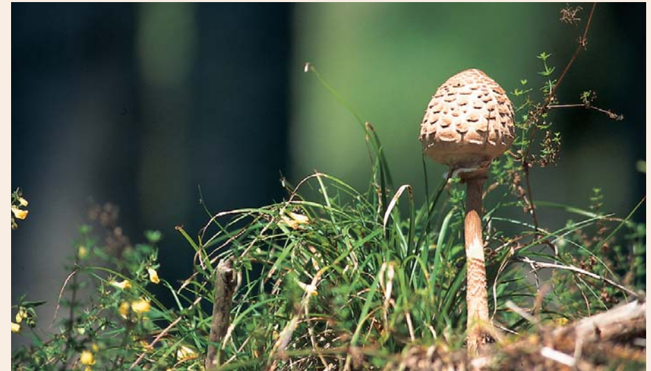
...Parasol ... getroffenen landesrechtlichen Bestimmungen.

Ein nebenberufliches Jagdschutzorgan darf nur 1.500 ha eines Jagdgebietes (oder mehrerer bei Genehmigung durch die BH nach Abs. 4 - siehe später) betreuen. Die Forderung, der Jagdschutz sei ausreichend auszuüben, hat hier also im Gesetzestext einen weiteren Niederschlag gefunden: Es ist nicht ernsthaft anzunehmen, dass ein Einzelner nebenberuflich mehr als 1.500 ha ordentlich beaufsichtigen kann. Ab 2.000 ha , wenn das Revier überwiegend aus Wald besteht, sonst jedenfalls ab 3.000 ha ist zumindest ein Berufsjäger zu bestellen. Das bedeutet, dass bei einer Reviergröße zwischen 1.500 ha und 2.000 ha bzw. 3.000 ha man mit zwei nebenberuflichen Jagdschutzorganen das Auslangen finden wird.