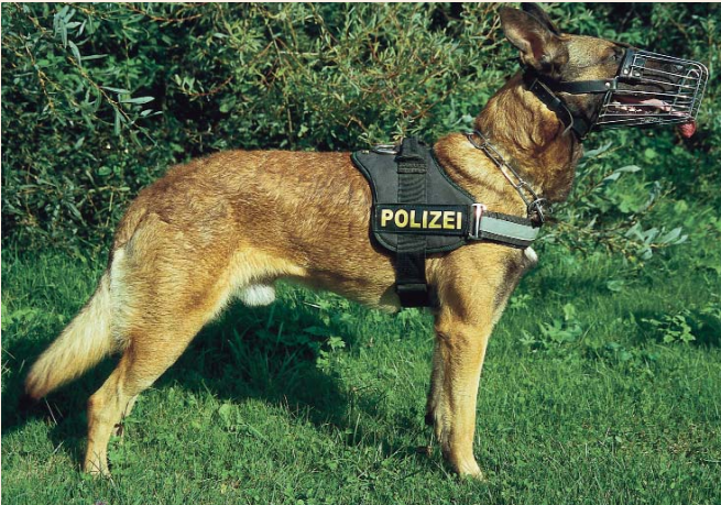
... Blindenhunden, Polizeihunden, Hunden der Gendarmerie, der Zollwache, des Bundesheeres und Hirtenhunden ...

einmal - ohne Aufsicht im Wald - gesehen habe, erfüllt er die Erfordernisse des Wiederholungstäters.