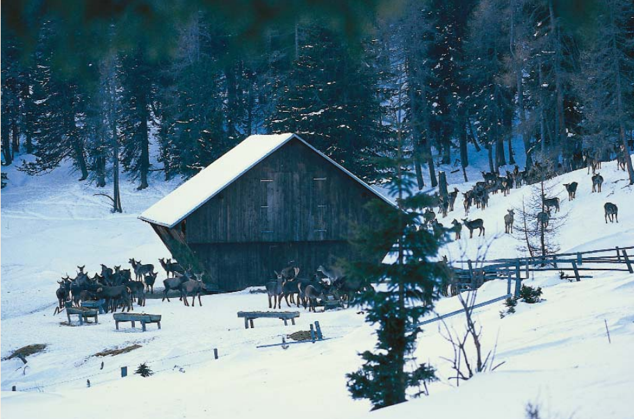
Geht hier auch alles mit rechten Dingen zu? Hegeringleiter und Bezirksjägermeister haben mit ihren Stellvertretern eine Überwachungsverpflichtung.