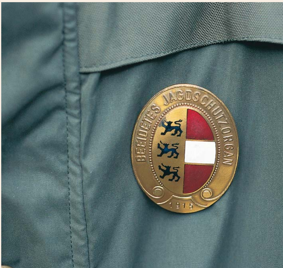
Das Dienstabzeichen des Jagdaufsehers ist sichtbar an der linken Brust zu tragen.

Aus all dem ersieht man, dass die Berechtigung, den Jagdschutz auszuüben, etwas Höchstpersönliches ist: Angelobung, Dienstaussweis mit Lichtbild und Unterschrift, persönlicher geht es schon gar nicht mehr. Aus diesen Gründen erscheint es wohl selbstverständlich, dass diese Berechtigung auch nicht kurzerhand übertragen werden kann, etwa: „Lieber Freund, ich fühle mich heute nicht wohl, gehst du bitte für mich ins Revier?“ Auch wenn der liebe Freund die Jagdaufseherprüfung hat, oder auch, wenn er selbst Jagdschutzorgan – in einem anderen Revier – wäre, ist das absolut unzulässig, genauso, wie man auch Jagdkarte (oder Führerschein) nicht leihweise einem anderen zur Verfügung stellen kann.