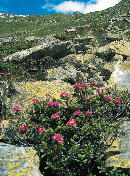
... Almrausch ...

Regelmäßigkeit gegeben (regelmäßig selten), nicht jedoch klarerweise das Erfordernis „ausreichend“. Der Gesetzgeber trägt dem Rechnung: