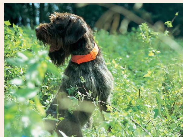
Das Tötungsrecht besteht nicht gegenüber Jagdhunden (Foto: Deutsch Drahthaar - DDR)...