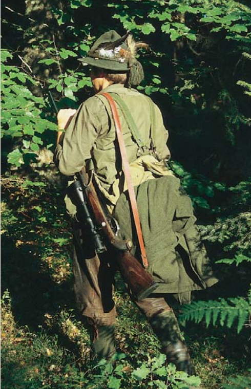
... wohl aber besteht bei einem derartigen Anblick ein begründeter Verdacht.